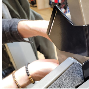
3.2 Plaats de accu terug in het frame.