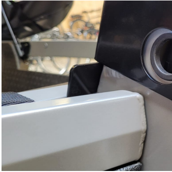
3.1 Draai de 2 bouten onder de accu weer aan.