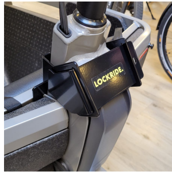
3.3 Monteer de schuif in de beugel en bevestig het Abus Diskus slot.