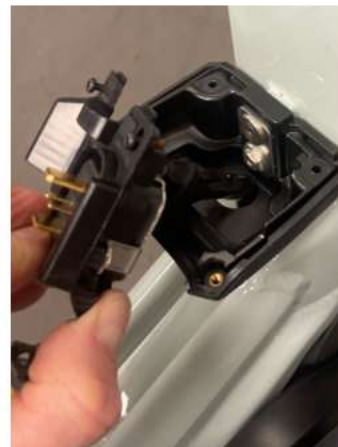
2.2 Nu kun je de schroef bereiken die in het frame gaat.