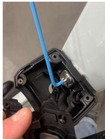
2.3 Schroef de bovenste schroef iets losser zodat er ruimte ontstaat tussen frame en docking.