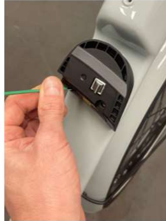
1.3 Schroef de slotkap los met een Inbus sleutel.