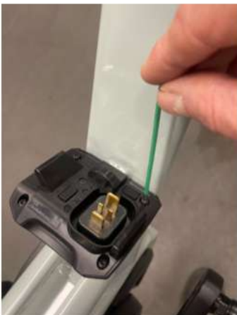
2.1 Schroef het kapje van de accu docking los met een inbus sleutel