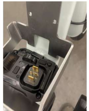
2.4 Zo kan je de Stepway beugel ertussen plaatsen.