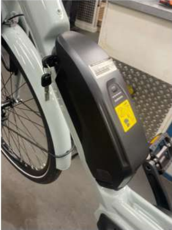
1.1 Haal de accu uit de fiets.