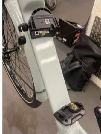
1.2 Haal de sleutels uit het Shimano slot.